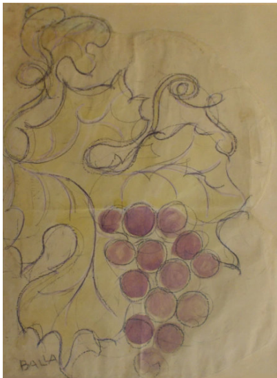
Studio per ricamo 1918 acquarello e matita su carta mm 440x320 a matita in basso a sinistra: BALLA