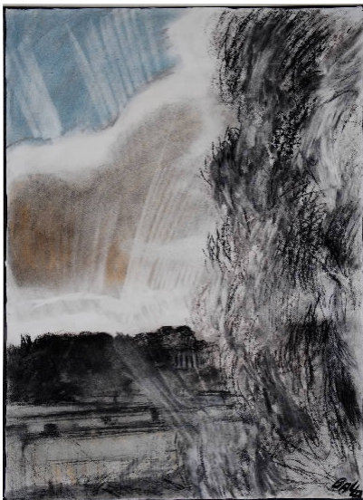
Eucalyptus a Valle Giulia, pastelli e carboncino su carta, 1927