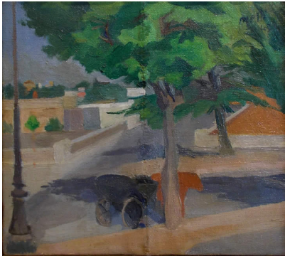
Barroccia a Ponte Testaccio, Roma 1945 olio su tela