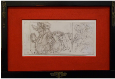
Studio per "Eroica"

(Trittico esposto presso la "Casa Madre dei Mutilati ed Invalidi di Guerra e del Lavoro" di Roma, 1907)