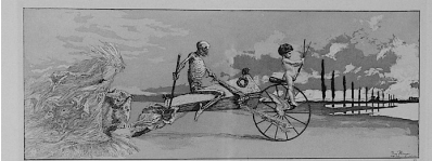
1891, 1892 (The Boat) (Love, Death and Aldila), aquaforte and aquatinta