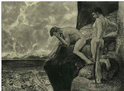
DER BEFREITE PROMETHEUS (Il Prometeo liberato)