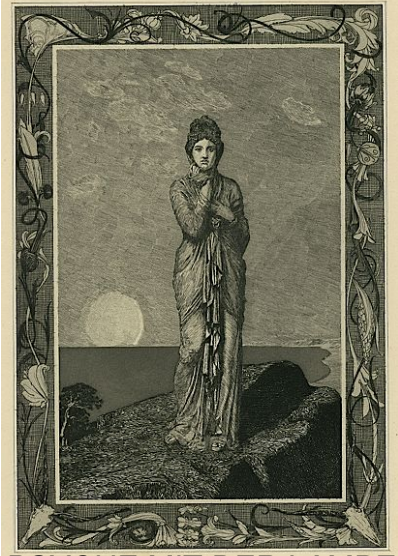
1891, 1892 (The Night) (The woman with the lamp)