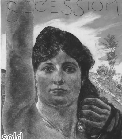
sold 5113 2599,76 Acquaforte, acquatinta e rotella