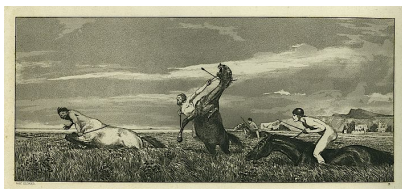
VERFOLGTER CENTAUR (Centauro inseguito)