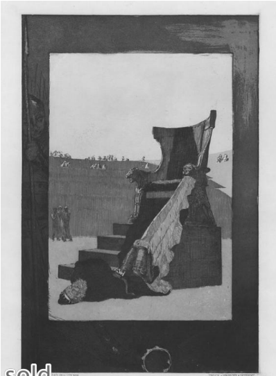
sold 5112 2599,80 Acquaforte e acquatinta