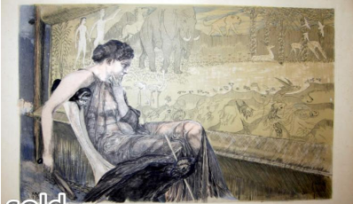
1891, 1892 (The Woman) (The woman with the lamp) sold for 100,000,000 (2009) and aquatinta impressa a colori